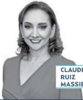
CLAUDIA RUIZ MASSIEU