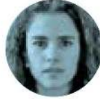
LUISA MARÍA ALCALDE

› Una bancada independiente pretenden constituir los cuatro senadores que el pasado lunes renunciaron al PRI. Claudia Ruiz Massieu, Miguel Osorio, Nuvia Mayorga y Eruviel Ávila buscan recibir el mismo trato que el PRD y el Grupo Plural, que sin tener el mínimo de cinco integrantes que se requieren para formar un grupo parlamentario se les concedió acceso a comisiones y a la Jucopo. Dicen que seguirán con su postura de oposición.