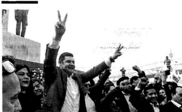
Alejandro Armenta, senador