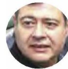
José Ramón Amieva

Hoy a las ocho de la mañana termina el mantenimiento al Sistema Cutzamala, que fue cerrado el miércoles. Sin embargo, el Jefe de Gobierno, José Ramón Amieva, advirtió que el punto crítico para la CDMX será el lunes, pues aunque bombee la maquinaria todo el sábado y domingo, falta ver si es suficiente para que el suministro de agua se regularice.