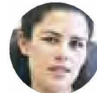
María Luisa Alcalde

Muy temprano en el sexenio llegó la prueba de fuego para la secretaria del Trabajo, María Luisa Alcalde. Nos dicen que la huelga que inició el Sindicato de la UAM va a medir la capacidad de la funcionaria y, con ella, la de la llamada Cuarta Transformación. Por lo pronto, este lunes las partes se reúnen a las cinco de la tarde en la Unidad de Conciliadores de la Secretaría del Trabajo y Previsión Social.