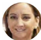
Claudia Ruiz Massieu