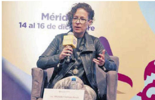
TOMADA DE TWITTER

entre ellos el senador morenista Ricardo Ahued , decidieron salir al quite y armar una cooperacha con la que pintaron camellones y protecciones en las principales avenidas. Por cierto, nos indican que lo más interesante es que el recién estrenado gobernador, Cuitláhuac García Jiménez (Morena), también aportó su grani-to de arena, supervisando y participando en las labores.