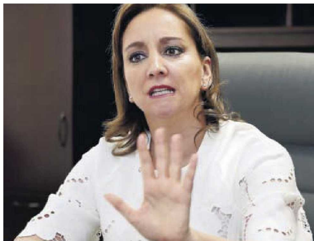
Claudia Ruiz Massieu