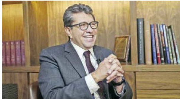
Ricardo Monreal Ávila