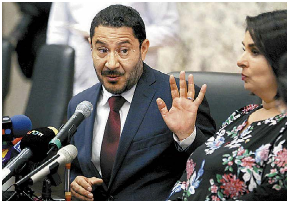
La disputa de Morena en el Senado anticipa la guerra fratricida. JAVIER RÍOS