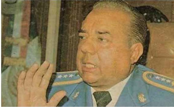
Arturo Durazo Moreno, director de policía y tránsito de la capital de la República, en el sexenio de José López Portillo.