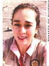
TOMADA DE TWITTER