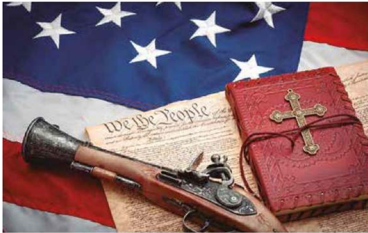
La segunda enmienda de la constitución de EU.