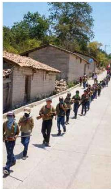
La propuesta priista de armar al pueblo.