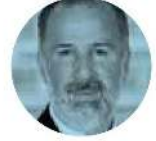
JOSÉ ANTONIO MEADE

› Pacto de "integridad electoral" firmaron el gobernador del Estado de México, Alfredo del Mazo ; el presidente del INE, Lorenzo Córdova , y el presidente del TEPJF, Reyes Rodríguez . Se trata de un compromiso para garantizar la equidad, el voto libre y el buen desarrollo del proceso electoral en la entidad. También se sumaron partidos locales.