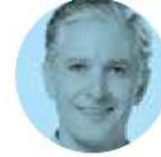
ALFREDO DEL MAZO

› En la Secretaría de Economía, a cargo de Raquel Buenrostro , hay mucho ánimo, porque prevén que se rompa el récord en la exportación de aguacates para el Super Bowl , el próximo 12 de febrero. Desde Michoacán ya se enviaron 64 mil 100 toneladas a Estados Unidos, y la meta de productores y autoridades es llegar a 130 mil.