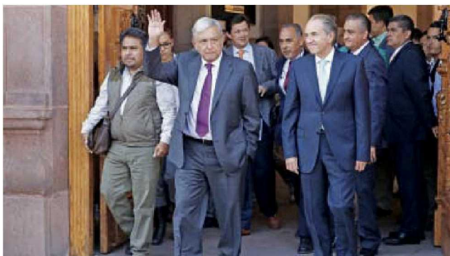
El presidente electo con el gobernador de San Luis Potosí