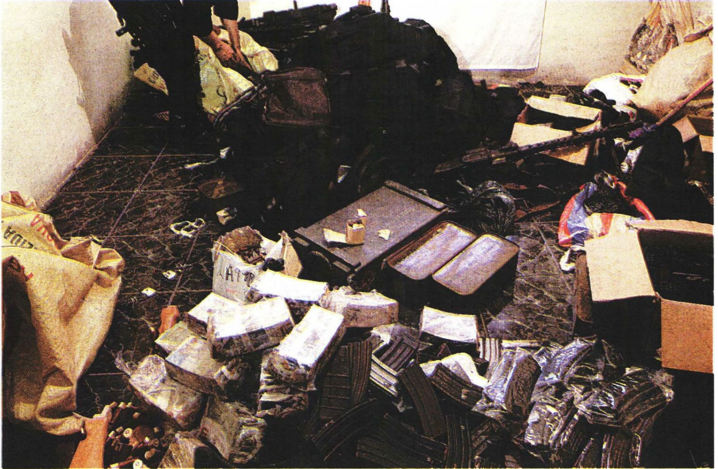
"Consiguió que lo dejaran entrar al inmueble antes de que los agentes borrarán la evidencia".