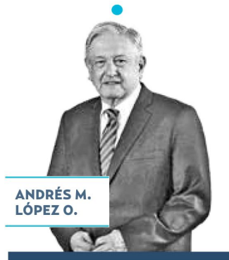
ANDRÉS M. LÓPEZ O.

› Frente a miles de sus seguidores, en lo que fue su último Grito de la Independencia, el presidente Andrés Manuel López Obrador ahora sí bajó el telón de su administración. Emotivo y lleno de aplausos, el tabasqueño inicia la cuenta regresiva para despedirse del movimiento que encabezó. Lo deja en manos de Claudia Sheinbaum, como también lo hace con la plaza que tantas veces llenó, como el principal opositor al régimen.