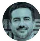
MIGUEL ÁNGEL YUNES MÁRQUEZ

» Reapareció el expresidente Ernesto Zedillo y habló sobre "la necesidad indispensable" de que la justicia sea impartida por jueces competentes, éticos e independientes. Fue a través de un video, en el que convoca a un evento sobre Estado de Derecho, a inaugurarse este 15 de septiembre, día en que, por cierto, AMLO promulga la reforma judicial.