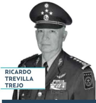
RICARDO TREVILLA TREJO