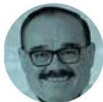
JORGE C. RAMÍREZ MARÍN

► Nos cuentan que en la bancada del PVEM en el Senado, comandada por Manuel Velasco , tienen grandes planes para Jorge Carlos Ramírez Marín . Y es que el yucateco se ganó el escaño a pulso, pues resultó ser el candidato a senador más votado de su estado. Y ese respaldo ciudadano es un gran capital político para él y para los verdes.