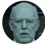
JUAN LUIS GONZÁLEZ ALCÁNTARA

► Nos adelantan que las controversias interpuestas por la oposición contra la supermayoría de la 4T en San Lázaro, nada cambiarán la conformación actual de la Legislatura. Lo que decida el ministro de la Corte, Juan Luis González Alcántara Carrancá , quien analiza el tema, de ninguna manera será retroactivo, ni contrario a la resolución del TEPJF.