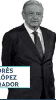
ANDRÉS M. LÓPEZ OBRADOR

► Balance del estado de la nación y una despedida emitirá el presidente López Obrador este domingo, 1 de septiembre, en el Zócalo capitalino. Será su sexto y último Informe de Gobierno, en el que no sólo difundirá los logros de su administración, sino que también contempla un mensaje de agradecimiento a los mexicanos. El acto inicia a las 11:00 horas y habrá invitados especiales; la principal, por supuesto, es la presidenta electa, Claudia Sheinbaum .