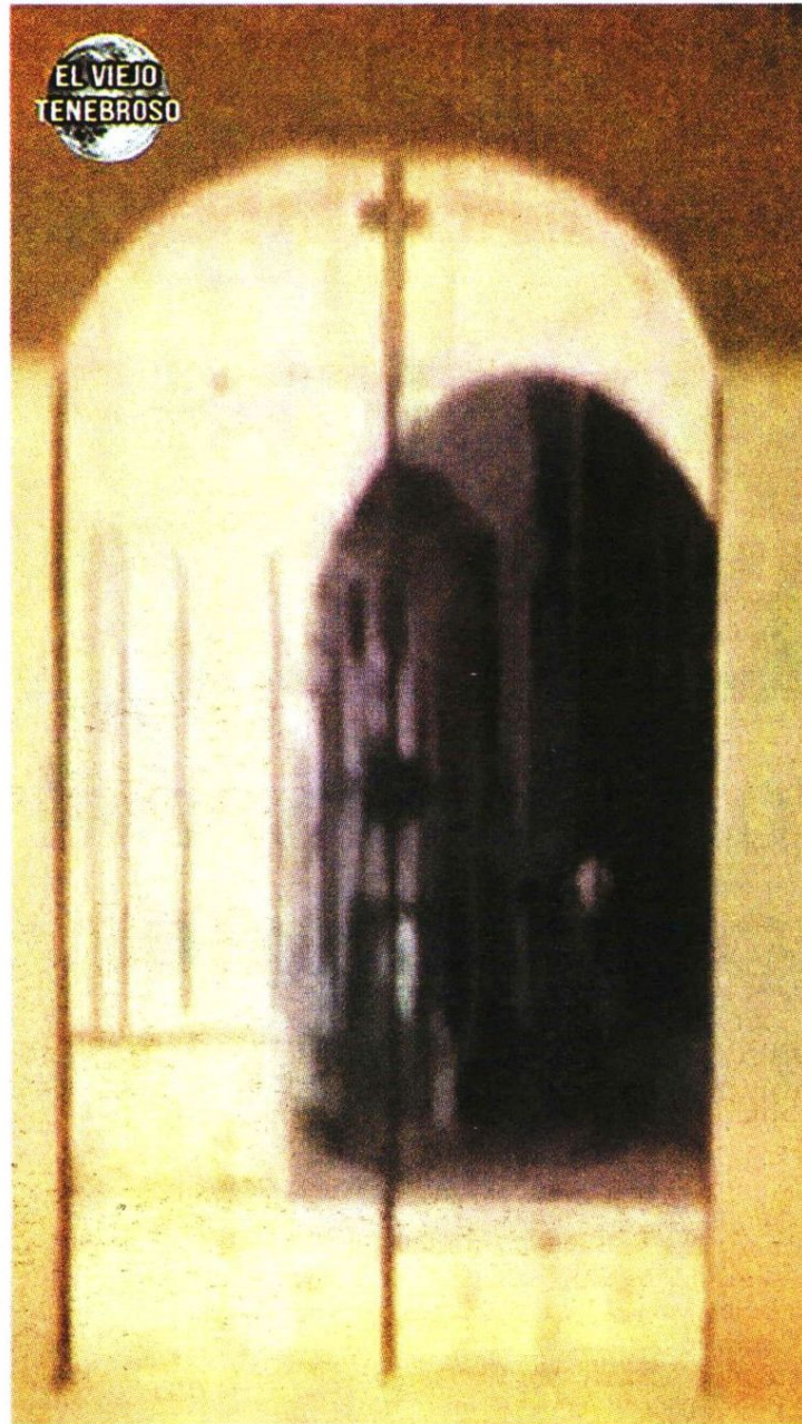
La imagen tomada por las cámaras de seguridad.

—¿No tienes miedo de estar aquí solita? —pregunté. —Cuando estaba viva sí, pero ahora no —respondió