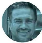
MIGUEL ÁNGEL YUNES MÁRQUEZ

› Por cierto, no terminan los problemas para la alianza PAN-PRI-PRD, pues un juez giró orden de aprehensión contra su senador electo, Miguel Ángel Yunes Márquez , por presunta falsificación de documentos, fraude y falso testimonio. Por supuesto, la Fiscalía de Veracruz, que sigue el caso, no tardó en pedir a la Interpol emitir una ficha roja.