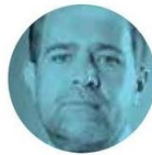
JORGE MARIO PARDO REBOLLEDO

› Por cierto, la Suprema Corte de Justicia de la Nación clausuró el primer periodo de sesiones de 2024, en medio de la polémica por la reforma al Poder Judicial. Nos cuentan que su presidenta Norma Piña se mantendrá divulgando su postura sobre dicha iniciativa, pero otros ministros, como Jorge Mario Pardo Rebolledo , se tomarán vacaciones.