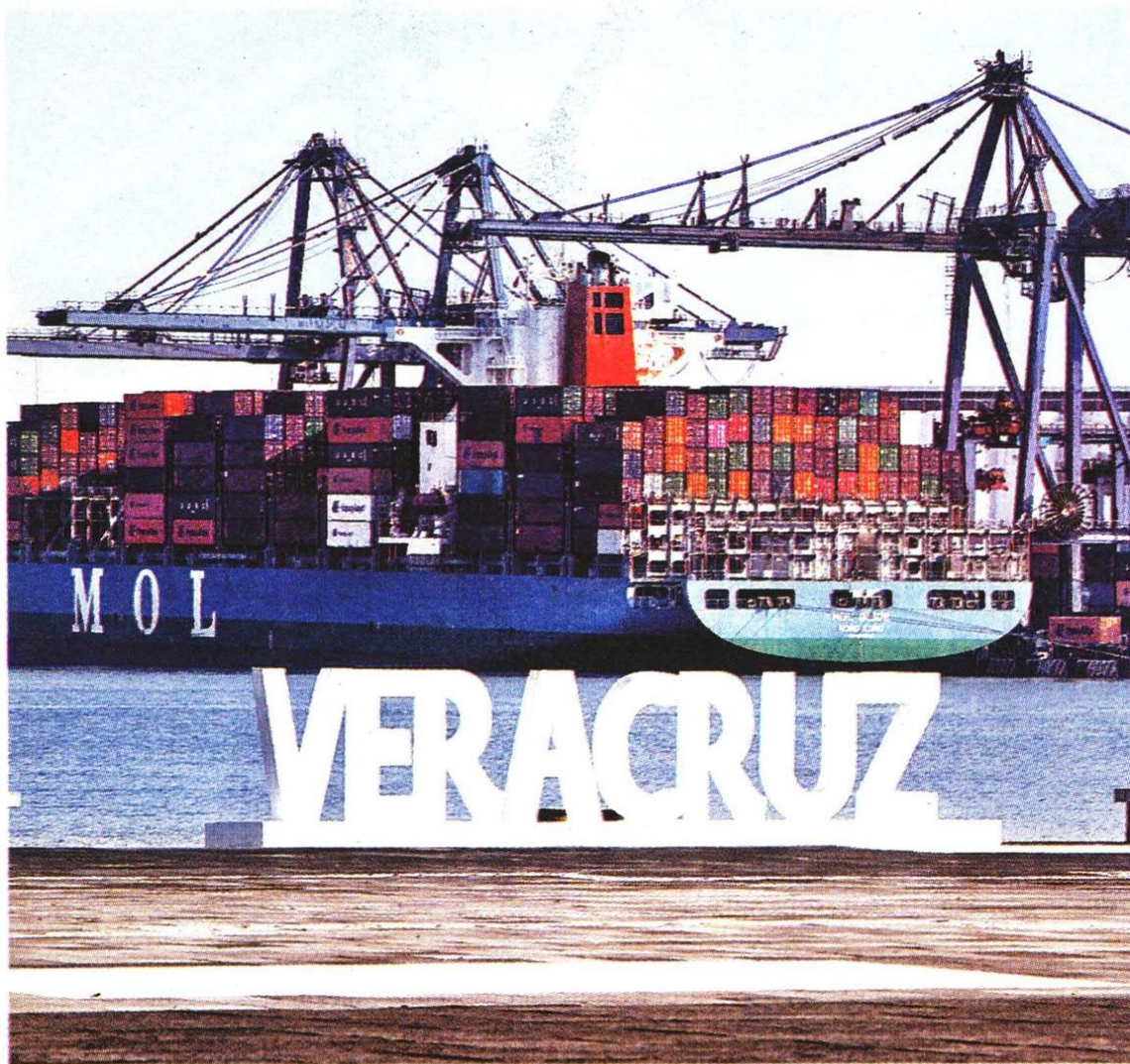
El viaje de Samy tomó semanas antes de que el puerto de Veracruz se asomara.