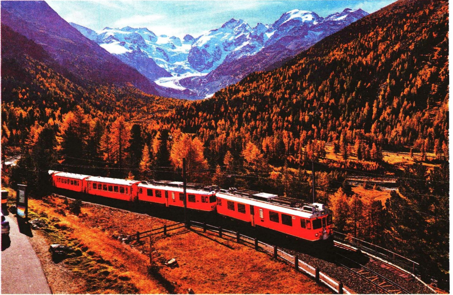
“El invierno es la última estación de cada viaje y ya no me quedan muchas despedidas más que celebrar”.