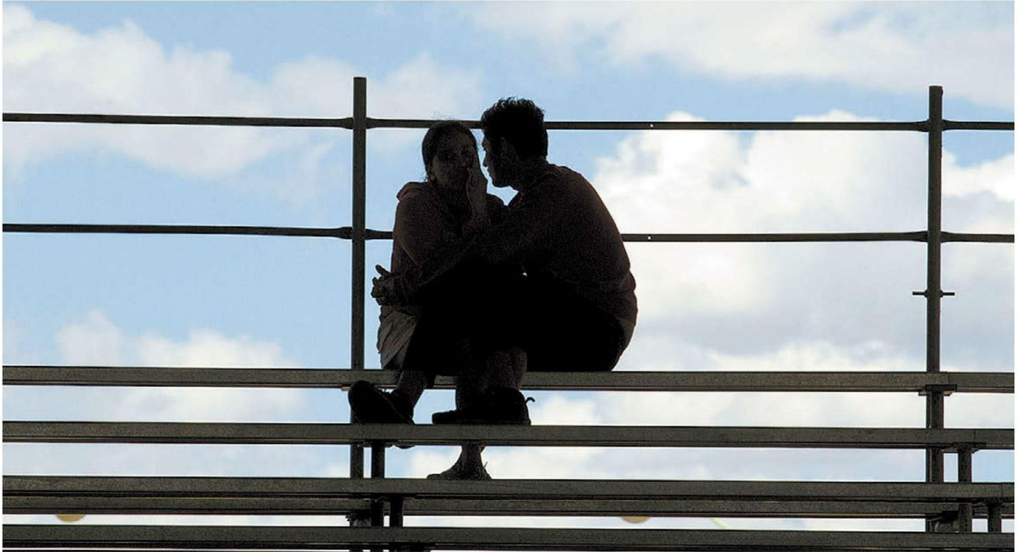
Los amores infieles nunca tienen una sola explicación. OCTAVIO HOYOS