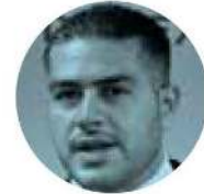
OMAR GARCÍA HARFUCH

► Repetirá Morena el método de las encuestas para elegir a sus abanderados que contendrán en la elección de nueve gubernaturas en 2024. El dirigente nacional de ese partido, Mario Delgado dará los detalles este domingo, durante el Consejo Nacional, y se espera que ahí mismo se afinen los detalles de la convocatoria.