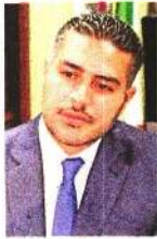
Omar García Harfuch

:::: Nos cuentan que luego de usar el "bastón de mando" para impulsar a Omar García Harfuch para la jefatura de Gobierno de la Ciudad de México, Claudia Sheinbaum está buscando llevar con suavidad el tema de la posible ruptura de Marcelo Ebrard . Por eso, nos detallan, ha establecido interlocución con la senadora guanajuatense Malú Micher , la más visible operadora del excanciller en la contienda interna y quien encabeza a los que dentro de ese equipo defienden la idea de quedarse a dar la pelea en Morena y evitar una ruptura con el presidente Andrés Manuel López Obrador . Pronto se verá si los rupturistas le reconocen el poder del famoso bastón o el asunto termina dirimiéndose a bastonazos.