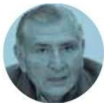
ADÁN AUGUSTO LÓPEZ

› Nos cuentan que en la oposición ven al ingeniero Cuauhtémoc Cárdenas metido en la sucesión presidencial. Pero lo perciben inclinado hacia el presidente López Obrador y Morena. Sobre todo, por sus comentarios respecto a que no ve propuesta en la oposición para 2024 y sus reiteradas declaraciones de que mantiene amistad con el mandatario. Incluso dicen que su hijo Lázaro Cárdenas Batel ya trabaja en la campaña de una de las corcholatas .