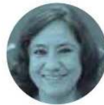
IRMA ERÉNDIRA SANDOVAL

› Por cierto, nos cuentan que el embajador de EU en México, Ken Salazar , está encantado con la secretaria de Seguridad, Rosa Icela Rodríguez , a quien ha tomado como una de sus más confiables interlocutoras. La última reunión que ambos sostuvieron fue el jueves pasado, y el diplomático quedó muy complacido con el encuentro.