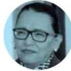
ROSA ICELA RODRÍGUEZ

rá, dicen, un "ejercicio inédito" en materia de rendición de cuentas.