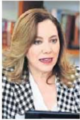
Blanca Lilia Ibarra

:::: Nos cuentan que en el Inai hay una denuncia muy concreta de hostigamiento sexual por parte de mandos del área de comunicación. El caso incluye el envío de fotografías de desnudos a una empleada del área, las cuales han sido ya constatadas incluso por los comisionados, pero por razones no justificadas, el principal implicado sigue en su puesto. El tema ha causado tensión entre los comisionados, que no están conformes con la decisión de la presidenta Blanca Lilia Ibarra de esperar a que se desahogue la investigación, sin tomar medidas para que la afectada no tenga que encontrarse diariamente con los perpetradores.