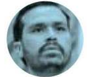
JORGE ÁLVAREZ MÁYNEZ

› Frente a la embestida de Morena en el Senado de la República, quien tendrá los reflectores mediáticos será nuevamente la Suprema Corte de Justicia, que preside la ministra Norma Piña , debido a que determinará el futuro de la avalancha de reformas que el partido guinda y aliados impulsieron en el Congreso de la Unión, sin discusión y sin apoyo de la oposición.