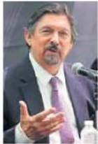
Napoleón Gómez Urrutia

:::: Hoy, mientras el presidente Andrés Manuel López Obrador encabece en Palacio Nacional el acto oficial de conmemoración del Día Internacional del Trabajo, el Zócalo capitalino será escenario de una manifestación de