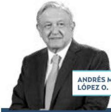
ANDRÉS M. LÓPEZ O.

› Este lunes 1 de mayo, inicia el presidente Andrés Manuel López Obrador , con sus actividades públicas habituales tras recuperarse del COVID-19 que le diagnosticaron la semana pasada, el cual dio mucho de qué hablar. Al mediodía encabezará la ceremonia con motivo del Día del Trabajo, al interior del Palacio Nacional. El evento, nos dicen, será a puerta cerrada, con una conmemoración al estilo de la 4T.