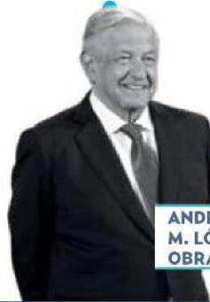
ANDRÉS M. LÓPEZ OBRADOR

► Recargado regresó el presidente López Obrador a la conferencia mañanera. Tras cuatro días de ausencia, tundió al INAI, a la Cofece, a la oposición, a periodistas y medios de comunicación. Incluso desactivó el supuesto acuerdo al que había llegado con su administración el ex director de Pemex, Emilio Lozoya , para librar el proceso penal, pues el mandatario elevó a mil millones de dólares, y no sólo 10 millones, la reparación del daño.