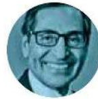
ROGELIO RAMÍREZ DE LA O

➤ Nos hacen saber que la bancada del PAN en San Lázaro, encabezada por Jorge Romero , ejerce presión contra el PRI, de Alejandro Moreno , para que se pronuncie contra la ley que limita funciones al Tribunal Electoral, a fin de que el asunto quede finiquitado. Quieren evitar que resurja el PRIMOR y el tricolor se sume al partido guinda.