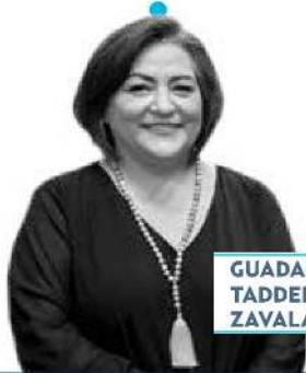
GUADALUPE TADDEI ZAVALA

El azar definió que Guadalupe Taddei Zavala presida el INE, a partir del 4 de abril. La seleccionada en la tómbola de San Lázaro recibió las felicitaciones del presidente saliente del Instituto, Lorenzo Córdova , quien convocó a sesión el lunes con el fin de que ella rinda protesta, junto con los otros tres consejeros insaculados: Rita Bell López Vences , Jorge Montaña Ventura y Arturo Castillo Loza . Toca a doña Guadalupe convenir de que es imparcial.