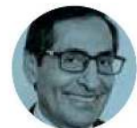
ROGELIO RAMÍREZ DE LA O

Muy acomedido anda el gobernador de Jalisco, Enrique Alfaro , con las corcholatas presidenciales de Morena. Hace ocho días recibió a la jefa de Gobierno, Claudia Sheinbaum , y le expresó su aprecio. Y ayer al canciller Marcelo Ebrard le manifestó su respeto y destacó su "relación de amistad". Por cierto, después el mandatario fue hospitalizado.