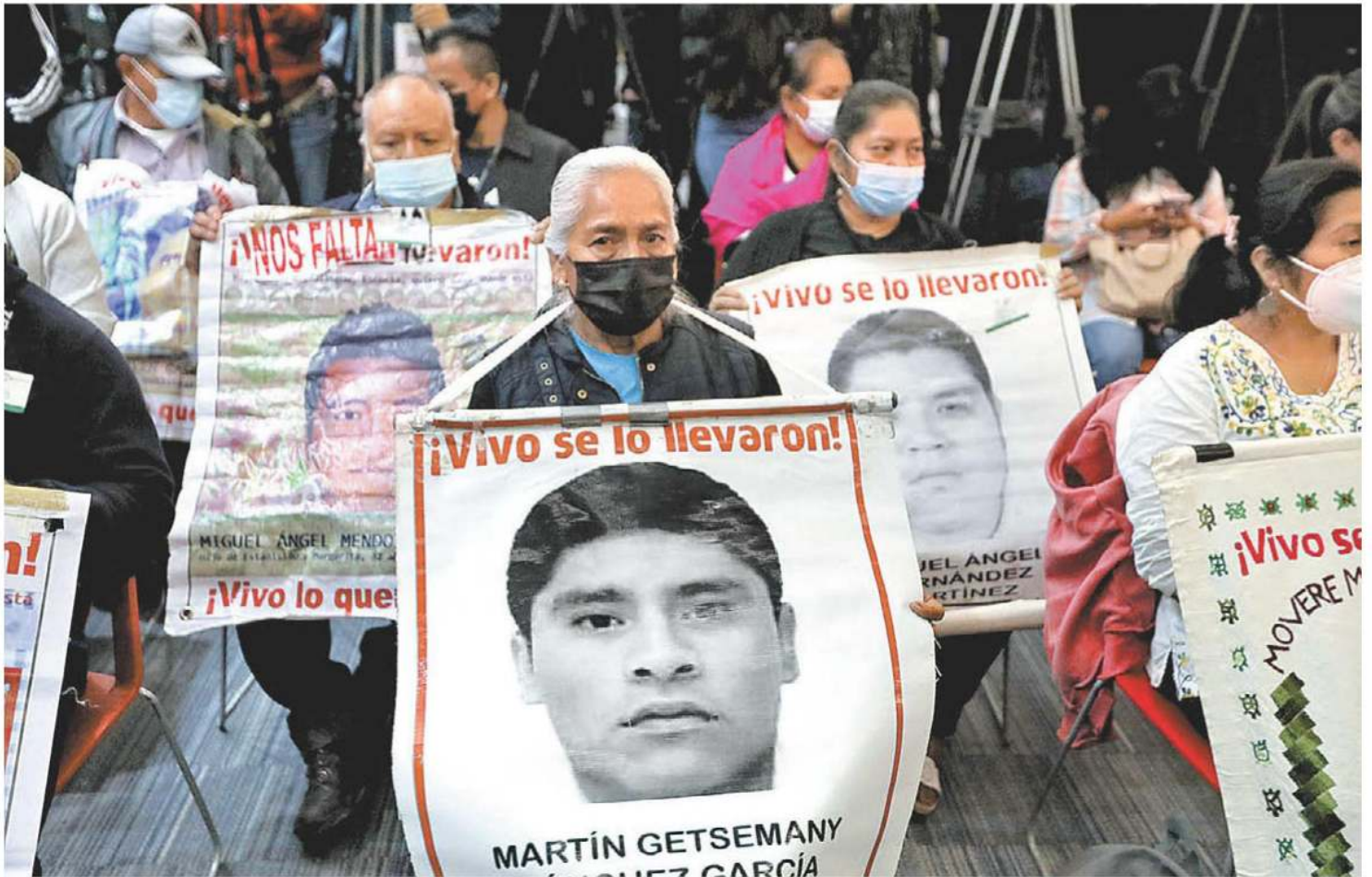
Manifestación para exigir la aparición con vida de los estudiantes normalistas. JESÚS QUNTANAR