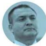
GENARO GARCÍA LUNA

cholatas, su gabinete, legisladores, alcaldes, líderes y militantes. La jefa de Gobierno, Claudia Sheinbaum , vaticinó un día "de fiesta" en el Zócalo, donde se congregarán para conmemorar el 85 aniversario de la Expropiación Petrolera.