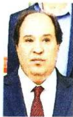
Lázaro Cárdenas Batel

:::: Nos cuentan que tras el anuncio de la salida de Lázaro Cárdenas Batel de la coordinación de asesores del presidente Andrés Manuel López Obrador , más allá de las interpretaciones sobre una presunta ruptura del cardenismo y la llamada Cuarta Transformación, lo que se dice en los pasillos de Palacio Nacional es que muy probablemente el puesto se quede vacante, tal como sucedió con la jefatura de la Oficina de Presidencia, acéfala desde la renuncia de Alfonso Romo en diciembre de 2020. En la última recta de su gobierno, nos hacen