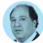
LÁZARO CÁRDENAS BATEL