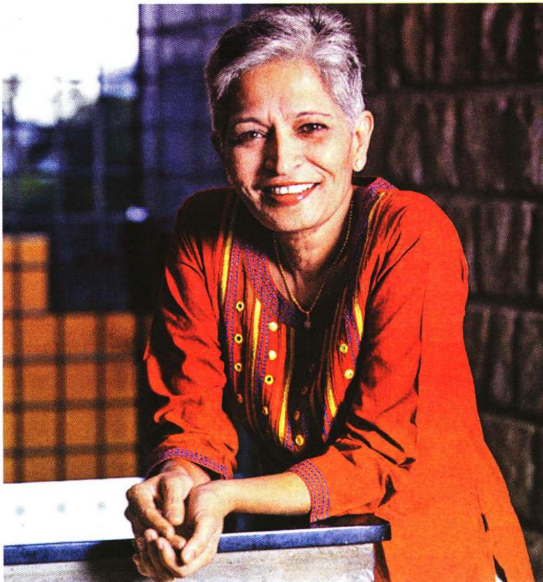
Gauri Lankesh fue asesinada tras publicar una nota sobre noticias falsas. ESPECIAL