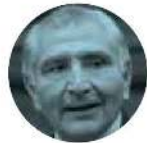
ADÁN AUGUSTO LÓPEZ

› Mucha expectativa hay sobre la llamada telefónica que tendrán el presidente López Obrador y el dueño de Tesla, Elon Musk . El canciller Marcelo Ebrard adelantó que en las próximas horas se dará esa conversación, en la que el magnate revelará al mandatario el estado del país en el que decidió construir su nueva planta.