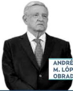
ANDRÉS M. LÓPEZ OBRADOR

› Reunión con funcionarios de Estados Unidos tendrá el presidente López Obrador el próximo lunes. Será a las 11:00 horas y el principal motivo del encuentro es la celebración de los 200 años de relaciones diplomáticas entre ambas naciones. Pero nos dicen que también se abordarán otros temas de la agenda bilateral, como los preparativos para la visita del presidente Joe Biden, en enero próximo, y asuntos relacionados con las controversias del T-MEC.