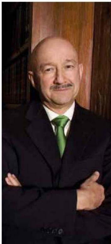
Carlos Salinas de Gortari.