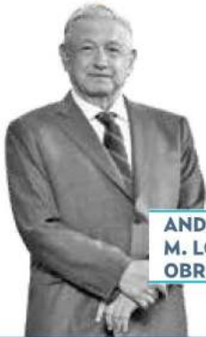
ANDRÉS M. LÓPEZ OBRADOR

Resulta que el emirato de Qatar invitó al presidente López Obrador a asistir a la inauguración del Mundial 2022, el 21 de noviembre próximo. El viceprimer ministro, Jeque Mohamed bin Abdulrahman Al Thani , quien se encuentra de gira en nuestro país, entregó personalmente la invitación al canciller Marcelo Ebrard, a quien también convocó. "Le importa a Qatar que el presidente de México, y México en general, estén en este gran evento, y lo apreciamos mucho", dijo Ebrard.