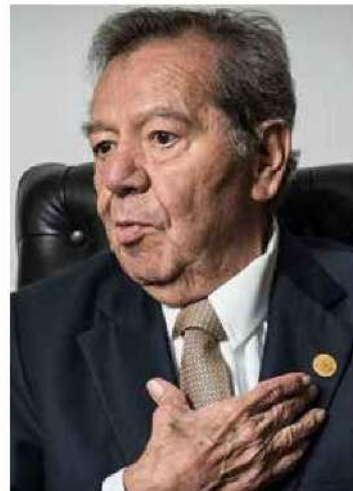
Porfirio Muñoz Ledo.