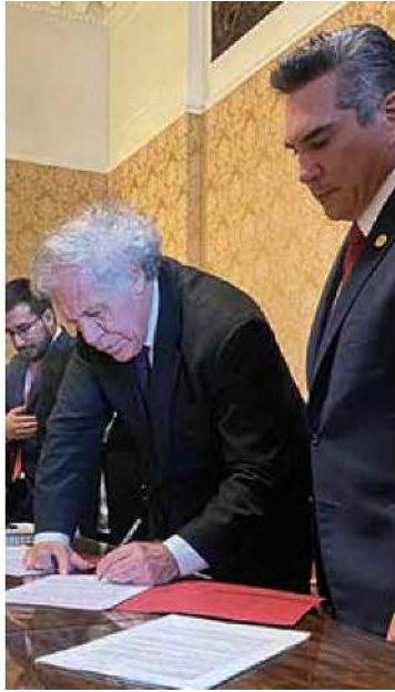
El presidente nacional del PRI, Alejandro Moreno Cárdenas, en el Capitolio y demás organismos internacionales.