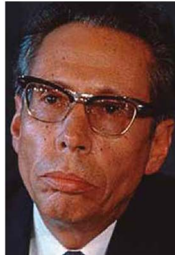
Gustavo Díaz Ordaz.