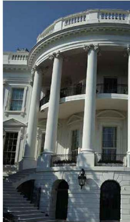
La Casa Blanca.

La Suprema Corte se va a jugar un espacio político determinante en la revisión de las reformas del Plan B electoral y en las 20 decisiones del rally legislativo del pasado fin de semana y la derrotada oposición está esperanzada en que los ministros de la Corte funcionales a los proyectos del viejo régimen le castren las alas al poder legislativo.