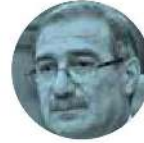
ALBERTO PÉREZ DAYÁN