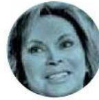
ELBA, BIEN Y DE BUENAS

► Resulta que el líder de los senadores de Morena, Ricardo Monreal , dejó claras sus prioridades no sólo en la política, sino en la vida misma. Ayer afirmó que "Nunca voy a traicionar al presidente López Obrador . Prefiero no ser nada, prefiero no participar en nada, antes de traicionar al presidente". Saquen sus conclusiones.