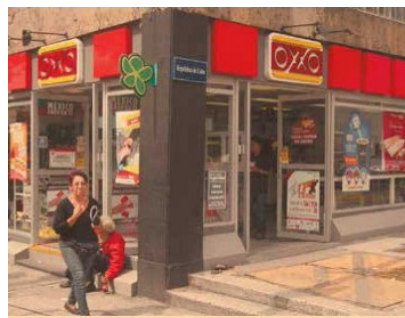
FEMSA emitió deuda en dólares en los mercados internacionales.

Siguiendo unos sencillos pasos, los dueños de los animales pueden crear una playlist para ellos. Para crear una lista se debe ingresar a la sección de animales de Spotify, donde hay cinco opciones: perros, gatos, hamsters, pájaros y hasta iguanas. Luego puede añadir información personal sobre su mascota, es decir, si es tranquila, nerviosa, curiosa, etcétera, y finalmente Spotify le da la mejor opción de música para su mascota.