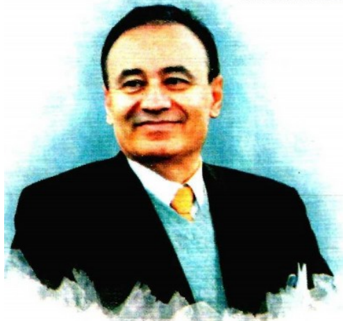
• ALFONSO DURAZO. Se planea un ejercicio con apoyo de las instancias policiales.