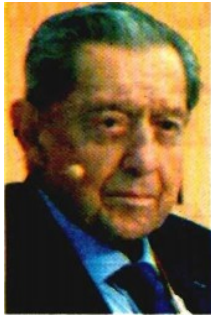
Miguel Alemán Velasco