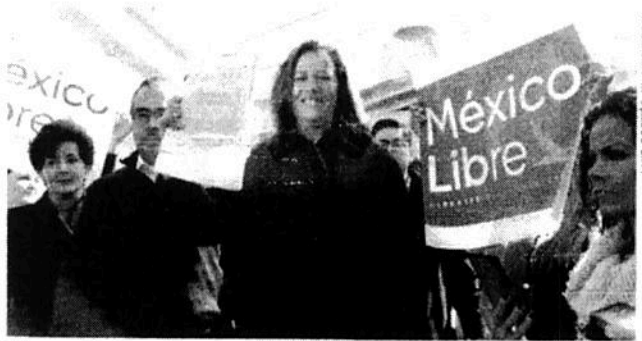
Margarita Zavala, ayer en el INE