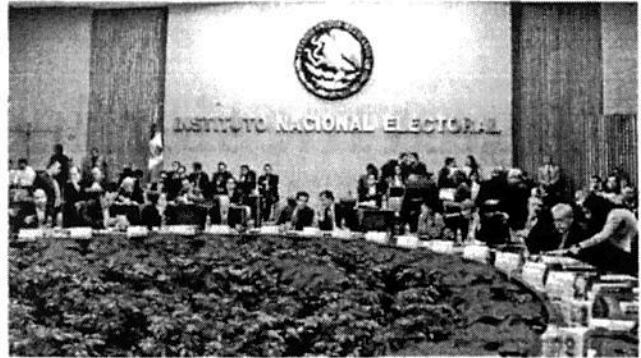
El INE prepara ajuste a su presupuesto