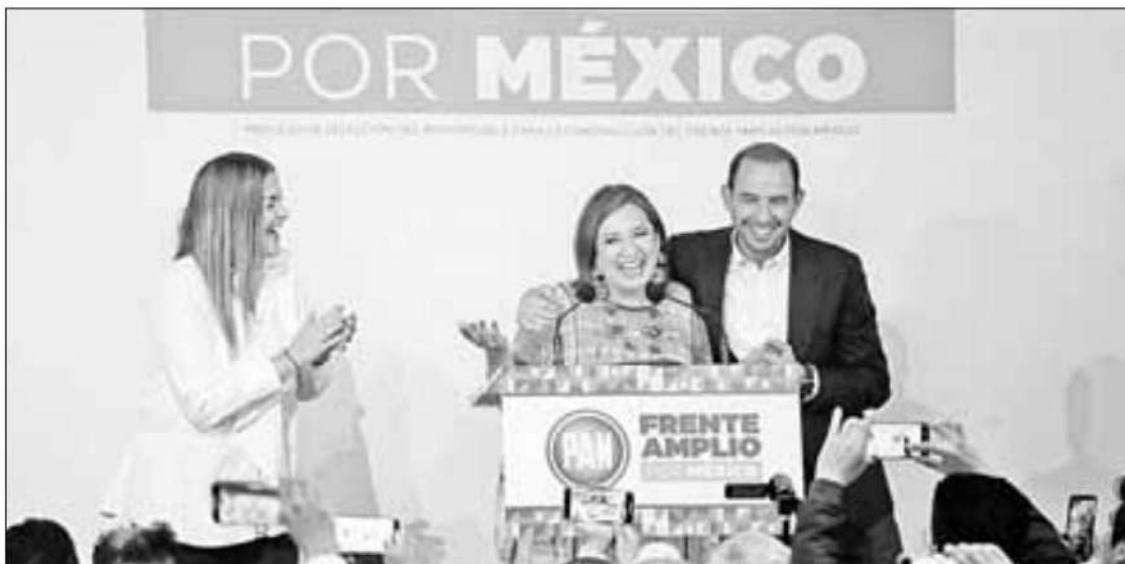
▲ La aspirante a la candidatura presidencial del Frente Amplio por México, Xóchitl Gálvez, acompañada del presidente nacional del PAN, Marko Cortés.

Twitter: @cafevega cfvmexico_sa@hotmail.com