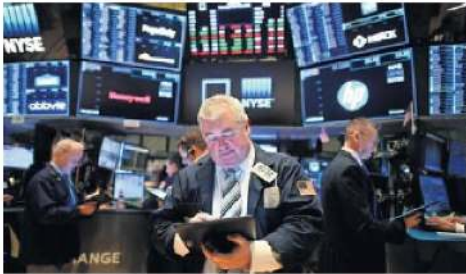
Actividad en bolsas de valores de Nueva York.