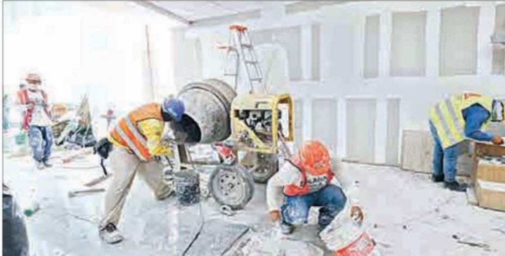
▲ Trabajos de mantenimiento en la Terminal 2 en julio de 2020. Ante el deterioro de las instalaciones, el gobierno analiza apuntalar el edificio.