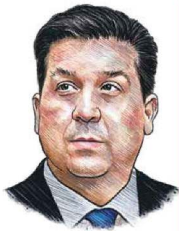
Francisco Javier García Cabeza de Vaca

H ACE MÁS DE veinte años se publicaron decretos de expropiación por el Gobierno de Tamaulipas para la construcción del puente internacional conocido por “Los Tomates”