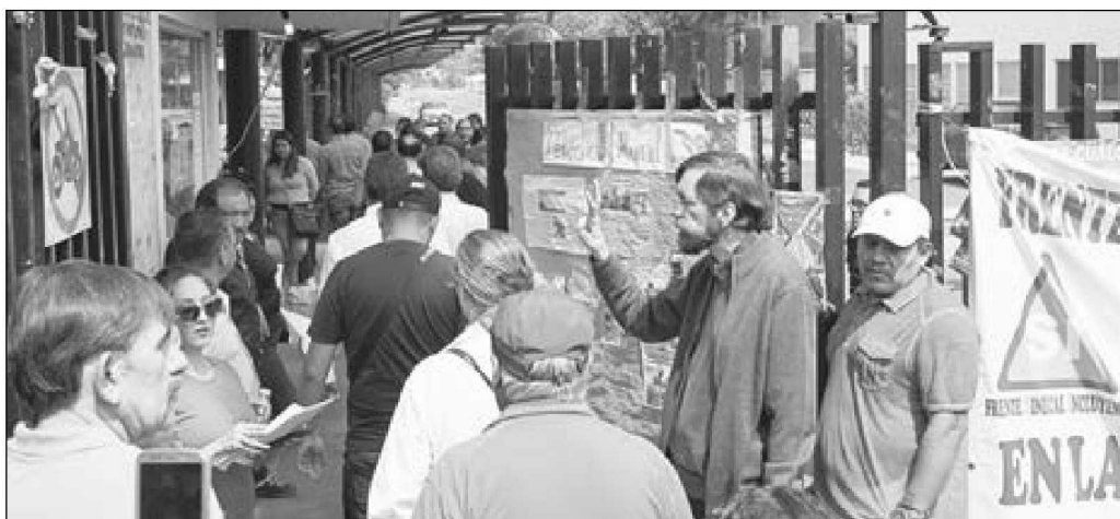
Después de 92 días de huelga se entregaron a las autoridades de la Universidad Autónoma de México las instalaciones de los planteles. En la imagen, los trabajadores pasan lista para poder ingresar.