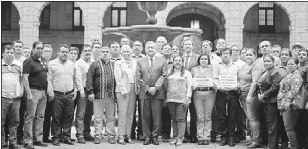
El presidente Andrés Manuel López Obrador recibió en Palacio Nacional, por segunda ocasión, a un grupo de la CNTE.

Facebook, Twitter: galvanochoa Correo: galvanochoa@gmail.com