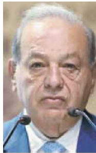
Carlos Slim Helú