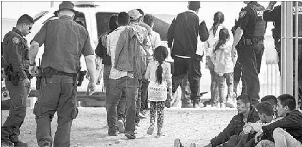
Todos los días, migrantes de varios países ingresan sin documentos a EU y se entregan a las autoridades en El Paso, Texas. Su esperanza es acelerar su solicitud de asilo.