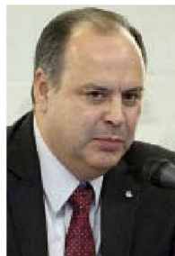
Gustavo de Hoyos

Nos cuentan que en estos días llegará la primera quincena bajo criterios de austeridad para los trabajadores de gobierno que fueron sujetos a recorte salarial por parte de la nueva administración. Nos explican que dependiendo del banco encargado de la nómina, para algunos funcionarios el pago cae entre los días 8 y 10 de cada mes. Nos cuentan que en algunos casos los trabajadores de gobierno siguen pagando impuestos relacionados con el seguro de separación individualizada, prestación eliminada por la Secretaría de Hacienda, y para algunos es un dolor de cabeza debido al fuerte descuento que representa. Nos comentan también que en dependencias como Condusef o Bansefi se están presentando despidos de personal y, en algunos casos se está ofreciendo recontratar con salarios más bajos y menos prestaciones. Con todo, nos dicen, el drama de los funcionarios públicos parece no tener fin en este arranque de sexenio.