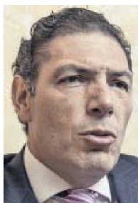
Carlos Hank González

junta de Ingresos. Al igual que el futuro secretario de Hacienda, Carlos Urzúa , es matemática de profesión y cuenta con una maestría en matemáticas aplicadas por la Universidad Estatal de Nueva York. La conexión con Urzúa viene desde la Secretaría de Finanzas del entonces Distrito Federal, en donde fue el titular cuando Andrés Manuel López Obrador era el jefe de gobierno.