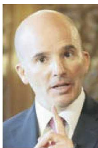
José Antonio González Anaya