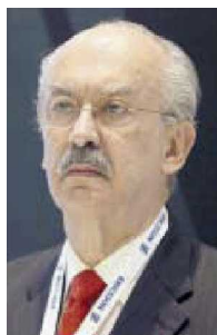
Francisco Gil Díaz

dar todos los bienes recuperados y así obtener recursos para los afectados. Además de las pérdidas económicas, el peor saldo que tendrá que enfrentar el equipo de López Obrador es detener al principal responsable del fraude, Rafael Olvera, quien nos dicen vive tranquilamente en Estados Unidos y, mediante amparos, ha frenado las demandas que tiene a cuestas en Florida.