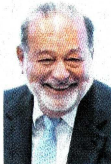
Carlos Slim Helú