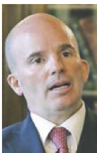
José Antonio González Anaya