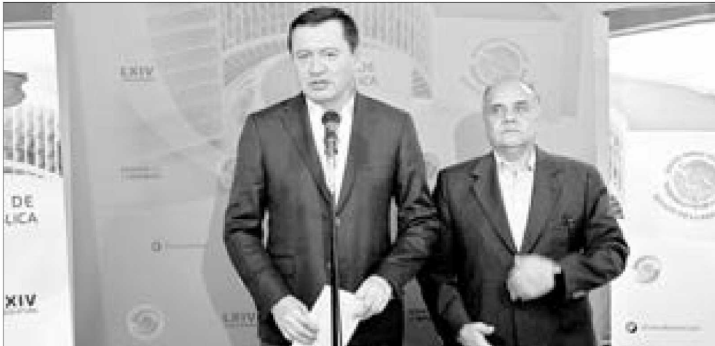
▲ Los senadores priístas Miguel Ángel Osorio Chong y Manuel Añorve Baños ofrecieron una conferencia de prensa en la que expusieron la postura de su partido ante diversos temas.