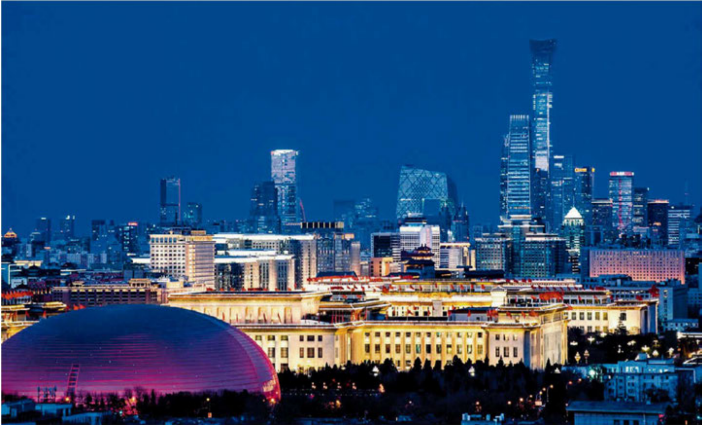
Gran Palacio del Pueblo en Pekín.

Las puertas de la nación están cada vez más abiertas y dan la bienvenida a amigos de todas partes del mundo