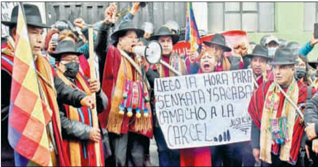
Manifestantes celebran en La Paz el arresto de Luis Fernando Camacho, gobernador de

el ultraderechista Luis Fernando Camacho, una suerte de Trump en miniatura y, hasta el miércoles pasado, gobernador del Departamento de Santa Cruz. Este impresentable forma parte del circuito latinoamericano de promotores de golpes blandos en contra de gobiernos legales y legítimos. Eso sí, con Biblia en mano.