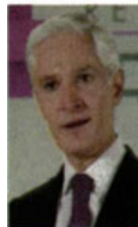
Alfredo del Mazo

:::: Nos cuentan que la Asociación Nacional de Empresas de Rastreo y Protección Vehicular (ANERPV) tiene como meta para 2023 reforzar sus estrategias para la recuperación de vehículos robados. Nos dicen que el Estado de México, gobernado por Alfredo del Mazo , tiene el mayor número