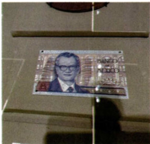
Homenaje a Miguel Mancera Aguayo, primer gobernador del Banco de México.

pláticas con las instituciones financieras privadas han sido complicadas, por lo que transcurrirá otro año sin que los clientes de Infonavit que contrataron un crédito cofinanciado con un banco resuelvan el aumento de su deuda. Un buen propósito para 2023, tanto para autoridades como banqueros, sería llegar a un acuerdo que beneficie a los acreditados.