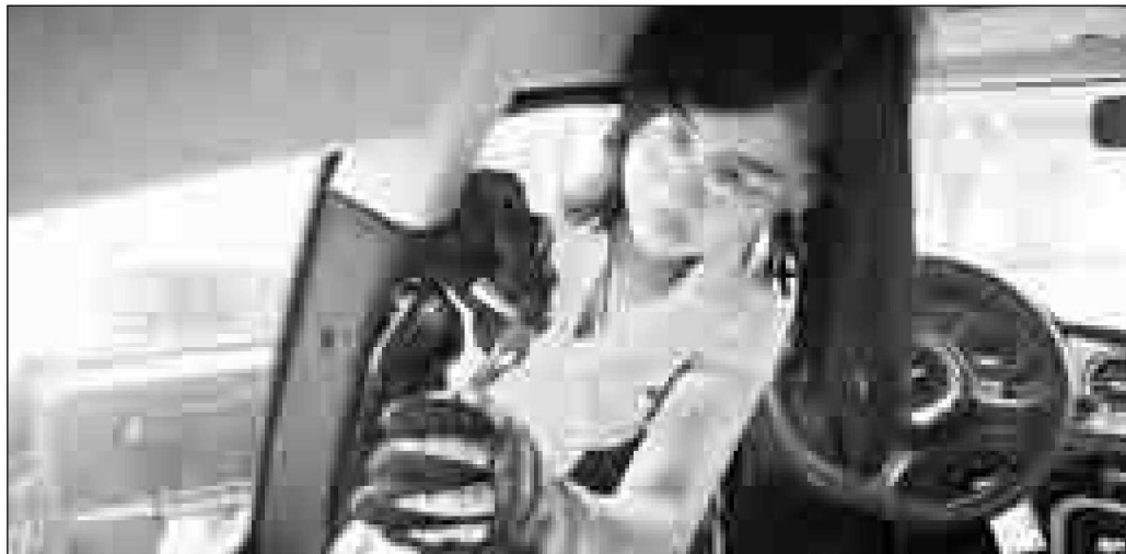
En esta planta del parque industrial Puebla 2000 se fabrica Zacua, el primer vehículo eléctrico mexicano.

Facebook, Twitter: galvanochoa Correo: galvanochoa@gmail.com